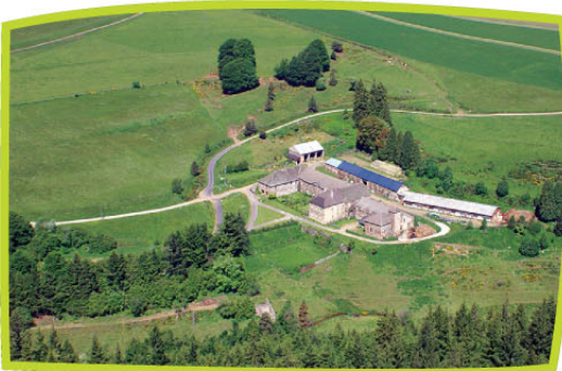
L'ANCIENNE ABBAYE VUE DU CIEL

En 1773, l'abbaye brûle presque entièrement. Seules l'église et la chapelle sont épargnées. Elle est rachetée par un particulier en 1875, qui la transforme en ferme (propriété privée).