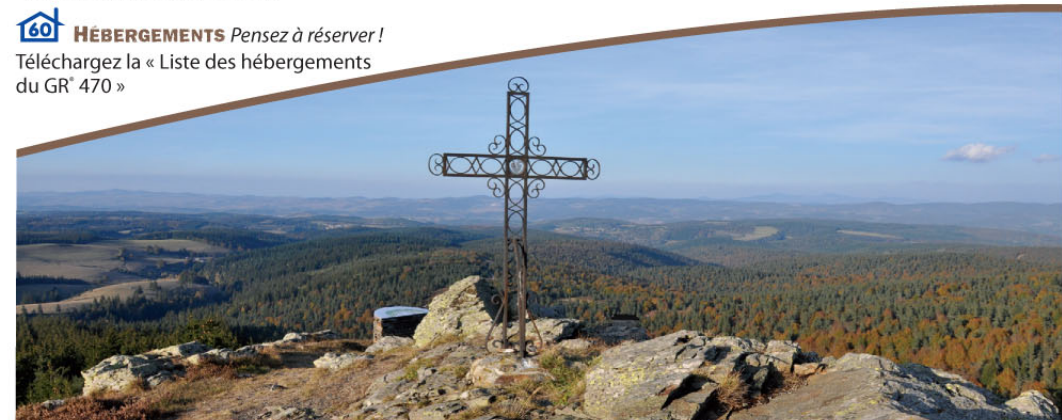
AU SOMMET DU MOURE DE LA GARDILLE (1503 M)